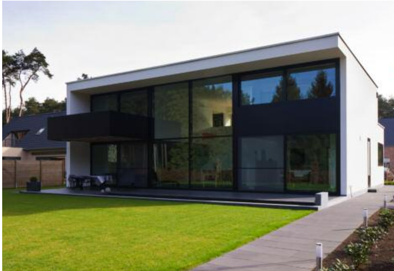
De achtergevel is bijna volledig uitgevoerd in glas en kreeg bovenaan een overkapping in de vorm van een uitkragend dak. De steunmuur die de overkapping gedeeltelijk draagt, dient meteen als beschutting voor het balkon en het overdekt terras.